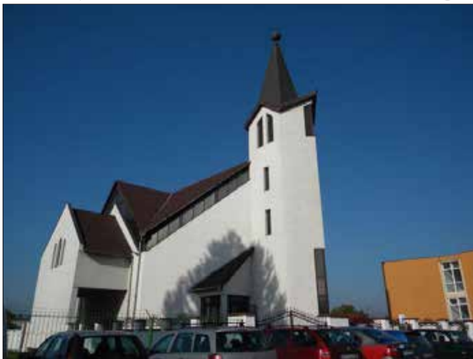
Az arad-gáji református templom

Egyházmegeink a reformáció 500. évének kezdetén 5533 gyülekezeti tagot számláltak a 20 anya-, illetve a két leányegyházközösségben. Szórványainkat az anyaegyházközösségek hozzájárulása révén tartjuk fent és látogatjuk. A 25 templomunkban és imaházunkban 15 lelkész és egy cseh anyanyelvű diakónus teljesít szolgálatot. Talán itt kell megemlíteni azt is, hogy a javarészt magyar anyanyelvű gyülekezeteink mellett van egy cseh gyülekezetünk is Nagyperegen, illetve Szemlakon a néhány idős gyülekezeti tagunk német anyanyelvű.