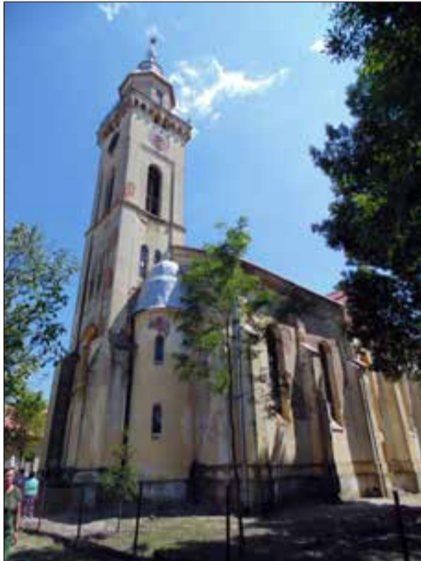
A szapárfalvi templom