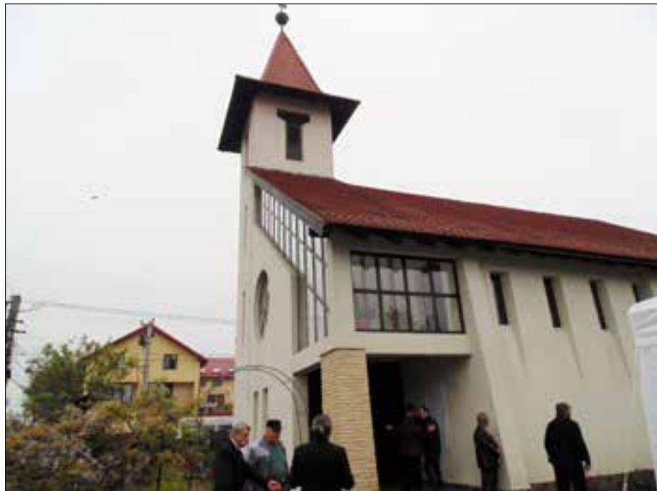
Az újkissodai templom

Most újból felújításra vár a templomtorny és templomfödél, valamint a felázott falak, a munkálatok kb. 25 ezer euróba kerülnének.