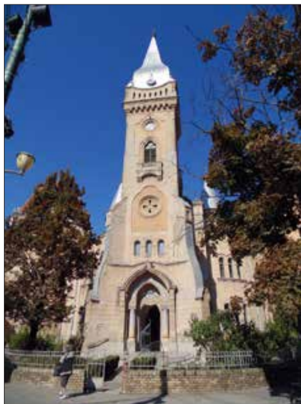
A piarista templom

Templomok felújítására gyűjtenek az innen elszármazott hívek pl. Zsombolya esetében. Vannak olyan községek, ahol a Németországba kivándorolt elszármazottak összetartanak, jól meg vannak szervezve és szép összegeket gyűjtenek össze az egyháznak, mint például az Arad megyei Újszentannán. Az itteni egyházközségek szegények, a zömmel idős hívek nyugdíjuktól élnek, nem tudnak hozzájárulni a templomok felújításához.