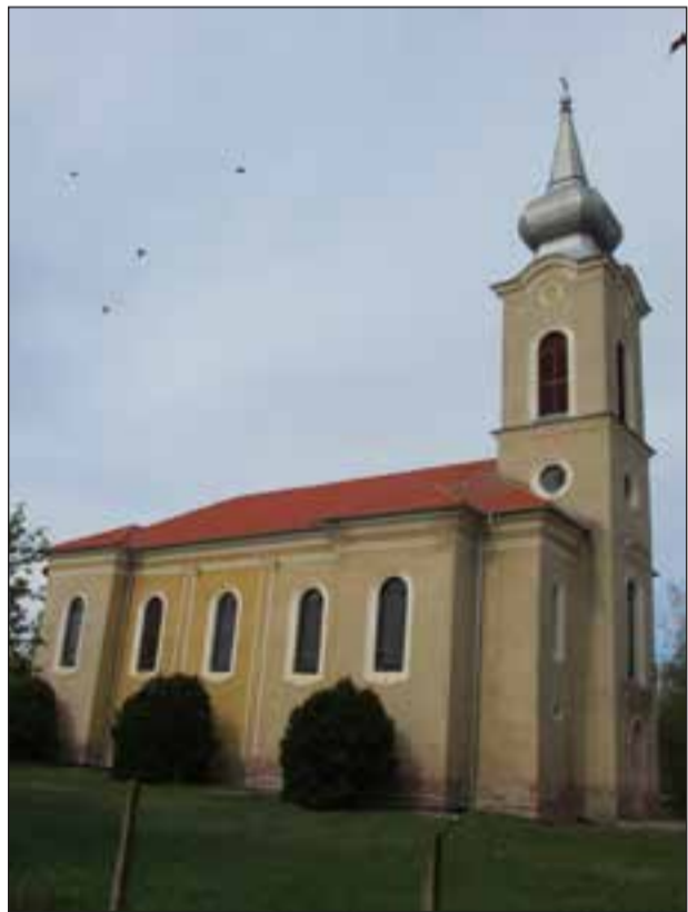
A kisiratosi katolikus templomot tavaly újrafedték, idén a villanyhálózatot újítják fel benne