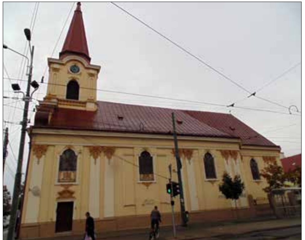
A józsefvárosi templom