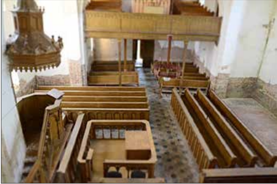
A nagybodófalvi református templom

Nt. Bódis Ferenc esperes szerint felújításra szorulna a szigetfalui és az újmósnaici református templom is. Szigetfalun 1990-ben volt egy nagyobb templomjavítás, majd a 2005-ös árvíz után a templom újra meg lett javítva.